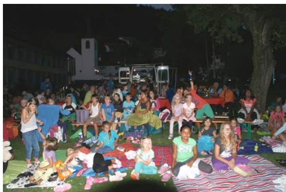
Gross und klein richtet sich gemütlich ein

Zu den Traditionen im Veranstaltungsprogramm der Bibliothek gehört mittlerweile das Wanderkino von Manuel Lindt. Beweis dafür war der nicht abreissende Ansturm von Leuten, die die herrliche Atmosphäre auf der lauschigen HPS-Wiese bei spätsommerlichen Temperaturen geniessen wollten. Rund 130 Personen amüsierten sich nach „Wurst&Getränk“ sowie dem Abschluss des Lesesommers über die Abenteuer von „Beethoven“, dem Bernhardiner.